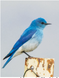
Mountain Bluebird.

Die Leute von Séliš, Qlispé und Ksanka heißen Sie herzlich im Bison-Schutzgebiet willkommen. Wir hoffen, dass Sie Ihren Besuch genießen. Im Jahr 2020 stellte der Kongress im Rahmen des Gesetzes 116-260 das Bison-Schutzgebiet den konföderierten Salish- und Kootenai-Stämmen wieder zur Verfügung. Für uns war dies eine monumentale Entscheidung. Sie ermöglicht uns, unsere althergebrachte Beziehung des Respekts und der Ehrfurcht gegenüber dem Bison aufrechtzuerhalten und unsere Sprache und unsere kulturellen Traditionen um dieses herrliche Tier mit Ihnen zu teilen.