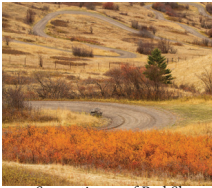
Serpentinen auf Red Sleep Mountain Drive.

Die West Loop und Prairie Drives sind kurze Routen in relativ flachem Land, die das ganze Jahr über geöffnet sind.