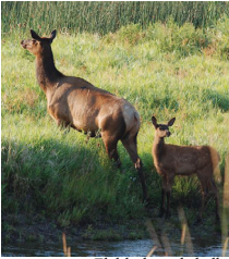
Elchkuh und -kalb.

5. Der Bitterroot-Trail ist nach den wunderschönen Bitterwurz benannt, die im Frühling wachsen. Bitterwurz ist für das Volk der Séliš, Qlispé und Ksanka eine kulturell sehr bedeutsame Pflanze. Der Wanderweg bietet auch einen atemberaubenden Ausblick auf das Tal.