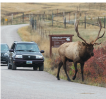
Die Tierwelt vom Auto aus ansehen.