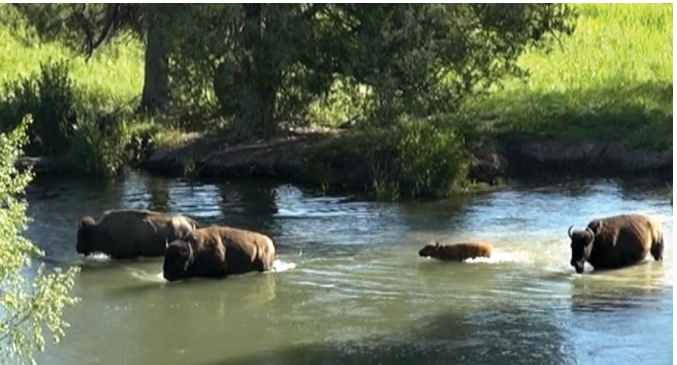
Überquerung von Mission Creek..

Das Mittel der Wahl, um das Bison-Schutzgebiet zu erforschen, ist ein Motorfahrzeug. Die Tierwelt ist an Fahrzeuge gewöhnt, weshalb Autos eine hervorragende Basis für Beobachtungen und Fotosafaris darstellen (gewerbliche Fotografen benötigen eine Fotografierlaubnis vom Besucherzentrum). Es ist verboten, sich von Fahrzeugen wegzubewegen, ausgenommen entlang ausgewiesener Wege oder des Angelgebiets.