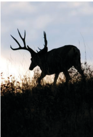
Maultier-Hirsch.