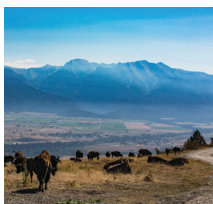
In der Nähe des Gipfels des Red Sleep Mountain Drive.